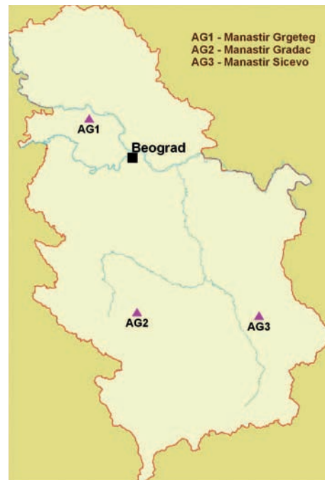
Географска локација три тачке на којима су вршена мерења апсолутних вредности убрзања

Такође, у више земаља Европе мерење апсолутних вредности већ је поновљено на истим тачкама у два или више навра-